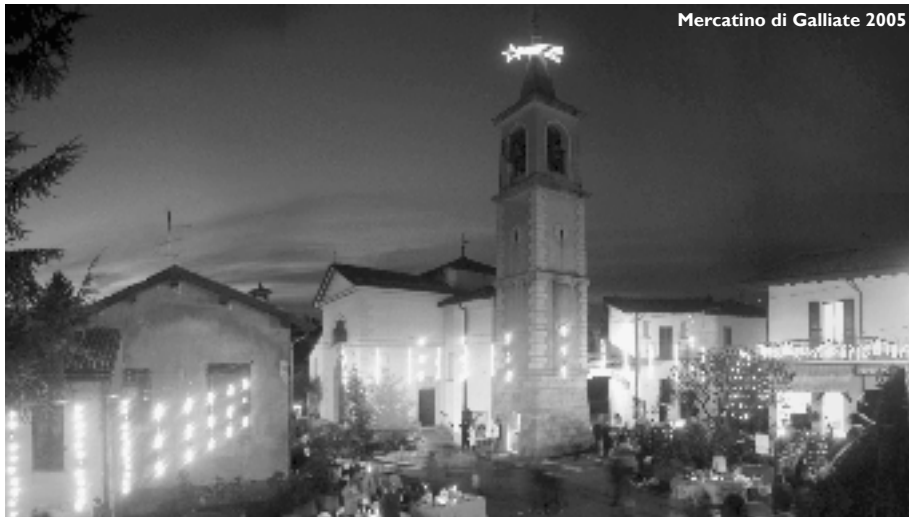
Mercatino di Galliate 2005

Oggi, ad un anno di distanza, vogliamo festeggiare con voi il nostro primo anno di attività regalando queste pagine di informazione e divertimento.